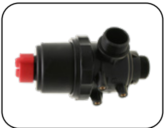
Filtro de admisión con check integrado