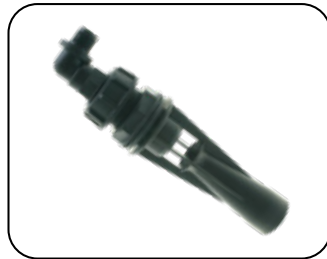
Agitador hidráulico tipo Venturi con injerto de cerámica