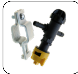
Porta boquillas en plástico de alta ingeniería, con antigoteo y tuerca de ataque rápido con punta de abanico plano