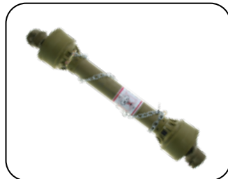
Eje Cardan Telescópico