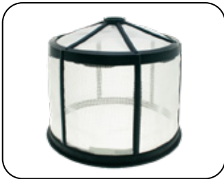
Coladera en la boca y tapa roscada con válvula check