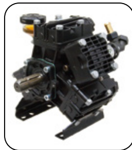
Bomba Delta 75