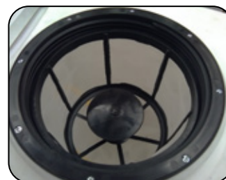
Mezclador hidráulico para polvos, ideal para disolver polvos humectables directamente en el tanque, ahorre tiempo ya que no necesitará realizar su mezcla en un contenedor aparte.